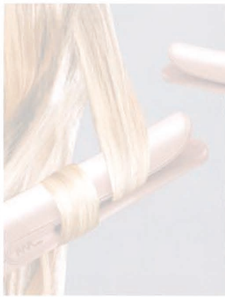
Der selbst drehende „Curl Revolution CI606“ – eine weitere Neuheit von Remington

Der „Curl Revolution CI606“ ist für alle Haarlängen und -typen geeignet. Fünf verschiedene Temperaturen können bei ihm eingestellt werden.