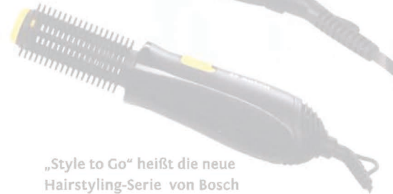
„Style to Go“ heißt die neue Haarstyling-Serie von Bosch