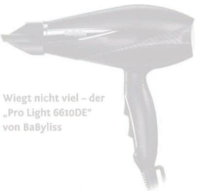
Wiegt nicht viel – der „Pro Light 6610DE“ von BaByliss

bürste mit Ionen-Generator und Keramik/Turmalin-Beschichtung. Auch bei ihr garantiert das „PTC Heat“-System schnelles Aufheizen und die konstante Einhaltung der gewählten Temperatur.