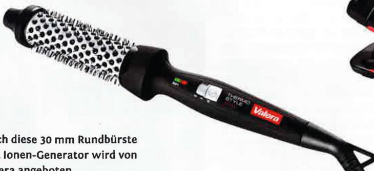
Auch diese 30 mm Rundbürste mit Ionen-Generator wird von Valera angeboten

ße Styling-Vielfalt. Mit 493 g ist er der leichteste in der Familie der AC-Haartrockner. Der neue „Pro Light 2100 W 6609E“ mit AC-Motor erzeugt eine Luftgeschwindigkeit von 95 km/h. Zwei Geschwindigkeits- und drei Temperaturstufen, Ionic-Funktion, eine echte Kaltluftstufe und schmale Zentrierdüse (6 mm x 75 mm) gehören zur Ausstattung. Komplettiert wird die Serie durch den „Pro Light 2000 W“ mit einer Luftgeschwindigkeit von 90 km/h, zwei Geschwindigkeits- und drei Temperaturstufen sowie einer schmalen Zentrierdüse (6 mm x 75 mm) und einer echten Kaltluftstufe. Ihn gibt es in den Farben Schwarz oder Weiß. Alle professionellen BaByliss-AC-Haartrockner werden in Italien hergestellt. ■