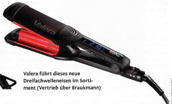
Valera führt dieses neue Dreifachwelleneisen im Sortiment (Vertrieb über Braukmann)