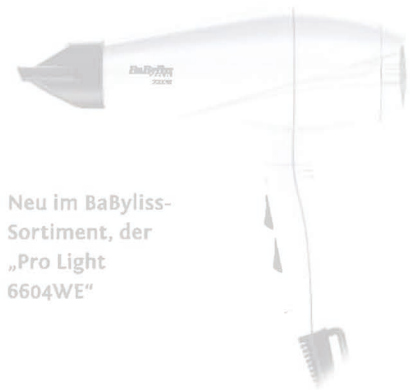
Neu im BaByliss-Sortiment, der „Pro Light 6604WE“