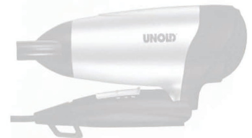
Der neue Unold-Haartrockner „Go“