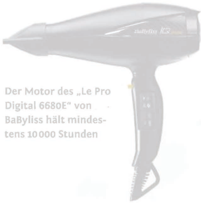
Der Motor des „Le Pro Digital 6680E“ von BaByliss hält mindestens 10000 Stunden