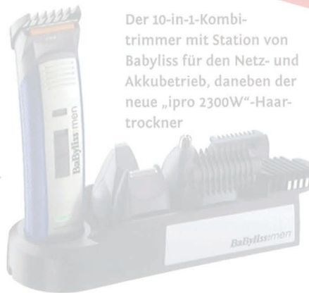
Der 10-in-1-Kombi-trimmer mit Station von BabyLiss für den Netz- und Akkubetrieb, daneben der neue „ipro 2300W“-Haartrockner

Ebenfalls als Neuheit war der Luftbefeuchter „Air Vital“ zu begutachten. Dank seiner zuschaltbaren Ionisier-Funktion befreit er die Luft auch von Staubpartikeln. Ein sechs Liter fassender Wassertank und eine Stundenleistung von bis zu 400 ml sind weitere Geräteigenschaften.