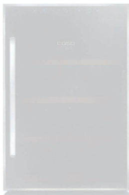
Caso stellte den Luftbefeuchter „AirVital“ (oben) und den „WineDuett Touch 12“ vor, Valera den Haartrockner „MetalMaster“ und den „Swiss’X Brush & Shine“-Haarglätter